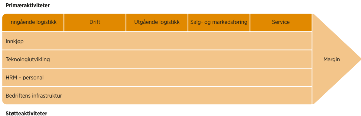
FIGUR 1 Porters verdikjedemodell